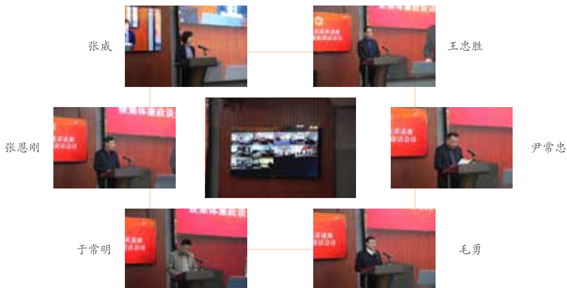
6 名机关部门和直属事业单位党组织负责人代表作述责述廉报告