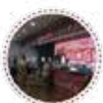
惠工消费援企平台