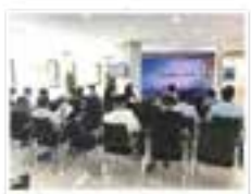
职工赋能关爱阵地