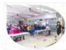
职工教育培训阵地