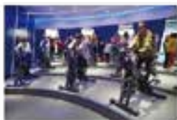
职工文化体育阵地