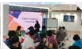
“十行百岗”职工赋能关爱