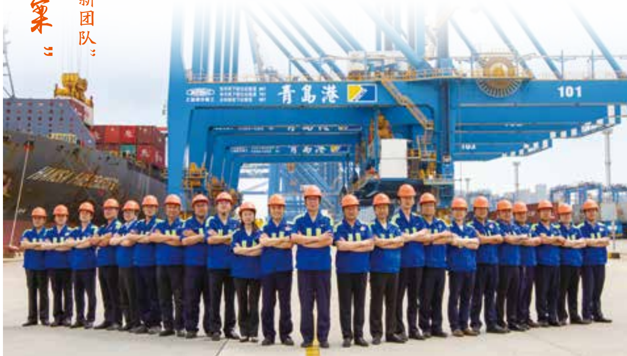
▲工作中的山东港口青岛港“连钢创新团队”。

青岛港全自动码头，是中国在这个领域的自主创新。正如德国“工业 4.0”提出者门蒂斯所言：“为世界提供了可复制、可推广、可商业化运营的‘中国方案’。”而拿出这个方案的，是一个由 25 位产业和技术工人组成的攻关团队，它的名字叫“连钢创新团队”。