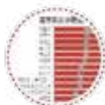
企业用工大数据平台

面对疫情常态化防控和经济发展新形势，围绕稳增长、保就业、促消费，搭建用工大数据、工友创业联盟、惠工消费援企等“六个平台”。实施“六惠工程”，开展“惠工优选”“直播带货”等惠工消费活动，拉动消费 4000 余万元。主动为小微企业返还工会经费 2731 万元。