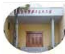
“三种精神”教育基地