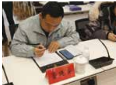
▲代表们填写评议表