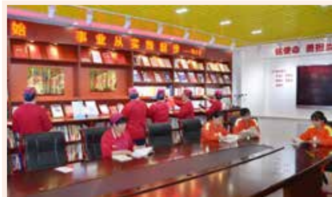
青 岛 港 职 工 书 屋 职 工 阅 读 活 动