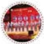
劳动竞赛激情建功平台