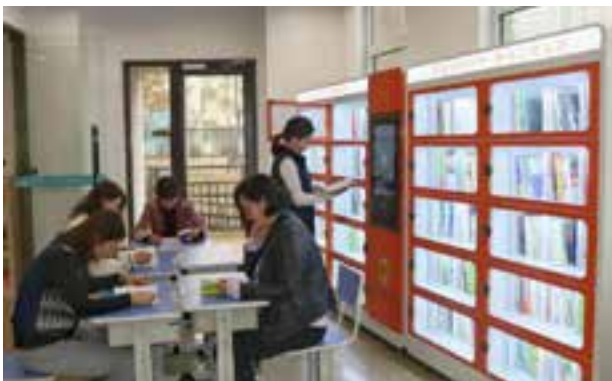
▲智能职工书柜自助借阅

“微信扫一扫，24小时自助借书”，地铁、火车站、机场、社区、企业“通借通还”……为推进阅读便利化，青岛工会在继续面向一线职工建设职工书屋的基础上，在人流密集场所推出24小时免费自助借阅书籍的“智能职工书柜”，让职工不必专门到书店、图书馆，在休闲娱乐、上下班途中就可以轻松借书，帮助职工系统利用碎片时间，满足深度阅读的精神文化生活需求，就像“把图书室搬到了身边”，给包括职工在内的市民带来了更便利的阅读体验，更贴心的文化服务。