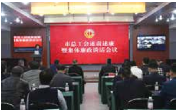
述责述廉暨集体廉政谈话会议

12月24日，市总工会召开述责述廉暨集体廉政谈话会议。6名机关部门和直属事业单位党组织负责人代表作述责述廉报告，其他基层党组织书记以书面形式进行报告，并现场接受了区市总工会主席质询询问和与会人员的民主测评。市总工会机关副处级以上干部、各直属事业单位和省总驻青单位党组织负责人参加会议，各区市总工会以视频方式参会，市纪委监委派驻第六纪检监察组同志全程现场监督。